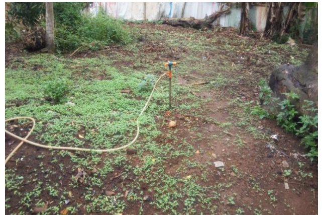
Bild 1: Monitoring und Betreuung bei der Einführung des organischen Anbaus in Matombo.